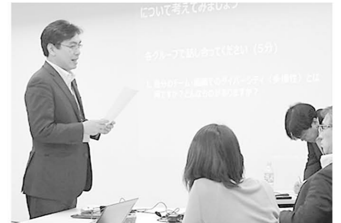
管理職研修イメージ

「もちろんすぐに全員の意識が変わるわけではありません。ただ、eラーニングを受けた人の多くから「気づきがあった」という回答を得