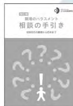
テキスト「職場のハラス メント 相談の手引き」 を使用します。