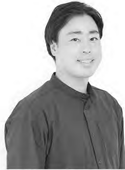
株式会社コスモスモア 管理部総務課課長